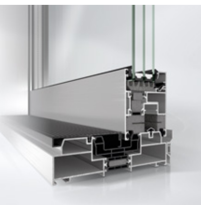
Schüco Hebe-Schiebesystem ASS 70.HI Schüco lift-and-slide system ASS 70.HI