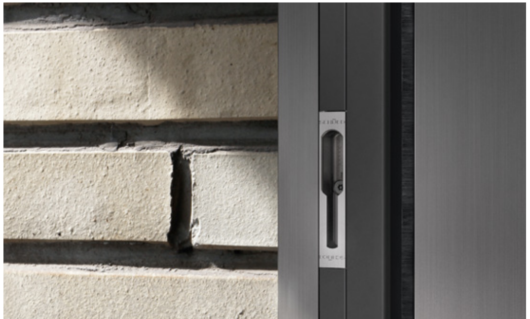
Beschlagsoption mit flächenbündiger Verriegelung im Blendrahmen Option de ferrure avec verrouillage à fleur dans cadre dormant

Die Schüco Schiebesystem-Plattform ASE 60/80 ist derzeit das einzige System am Markt, bei dem das Beschlagsystem sowohl als Schiebe- als auch als Hebe-Schiebe-Beschlag eingesetzt werden kann – und dies in zwei Varianten.